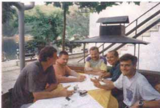
Unser Coach mit den siegessicheren Prüflingen

Am späten Nachmittag liefen wir aus und nahmen Kurs auf Valun, wo einst die Fernsehserie 'Der Sonne entgegen' gedreht wurde, um dort zu Abend zu essen und die Nacht zu verbringen.