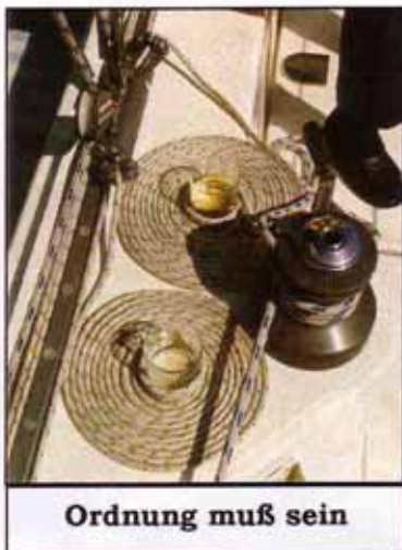
Ordnung muß sein

Den Vormittag des 7.4. verbrachten wir mit der Besichtigung von Bonifacio und liefen daher erst um 13:00 aus. Bei Windstärken von 3-6 Bft. aus Westen konnte unsere „Aranui“ zeigen, ob sie auch schnell sein konnte. Sie konnte. Sieben Segelstunden und 60 NM waren recht akzeptabel. Spass und Wind führten uns an diesem Tag zunächst nach Olbia im NO auf Sardinien und dann nach Porto Cervo zurück.