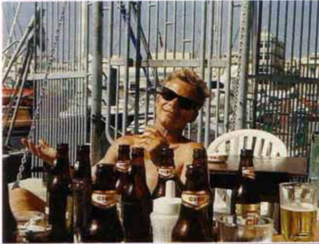
CISK Bier zum Feiern

Malta. Mit einem Schnitt von 6 M pro Stunde würden wir am frühen Abend da sein. Das Wetter war wieder ausgezeichnet, der Wind brauchte ein bißchen Zureden um aufzu-